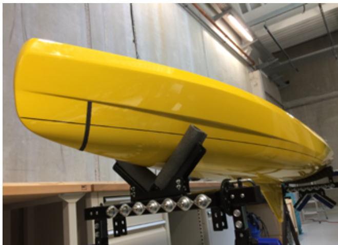
Modellrumpf hergestellt im 3D-Druckverfahren