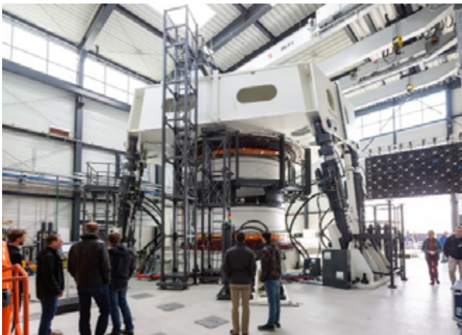
Prüfstände wie dieser für Großlager des Fraunhofer IWES in Hamburg stehen für die Erprobung von Windantriebssystemen auf Schiffen zur Verfügung

American Bureau of Shipping, Bureau Veritas, ECO-Flettner, Freudenberg Fuel Cell e-Power Systems, Hartmann Shipping Services Germany, HB Hunte Engineering, Hochschule Flensburg, judel/vrolijk & co design+engineering, MARIKO, Nautitec, Ostseestaal, Peters Werft, Reederei Rörd Braren, Verband Deutscher Reeder