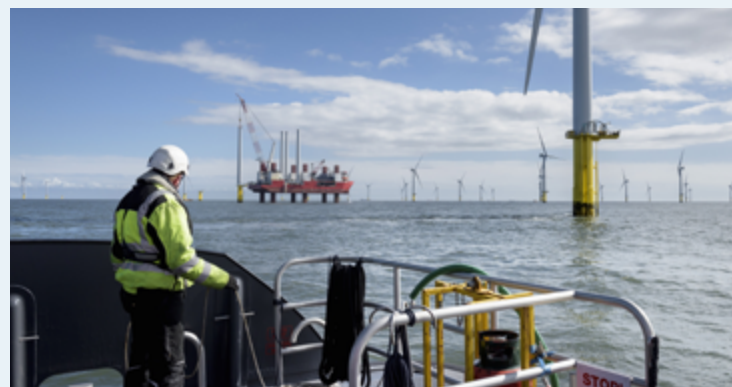
Offshore-Windenergie als Quelle synthetischer Kraftstoffe für die Schifffahrt